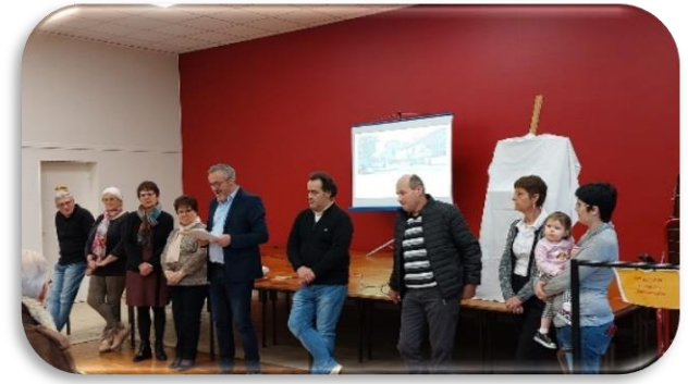
Nouvelle année : galettes et vœux