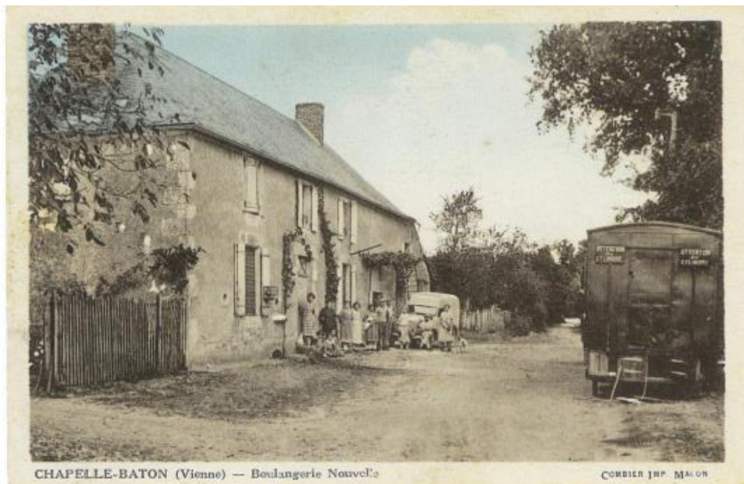
CHAPELLE-BATON (Vienne) — Boulangerie Nouvel

Nous avons besoin de vous pour alimenter cette rubrique. Aujourd'hui, nous a été transmise la photo de l'ancienne boulangerie situé Rue des Grands Chênes. Vous souhaitez enrichir notre base de document ou photos de la Chapelle-Bâton Bourg et ses lieux-dits, n'hésitez pas à nous les faire parvenir par mail à : a.capella86250@gmail.com ou les déposer à la Mairie, où nous en ferons des copies.