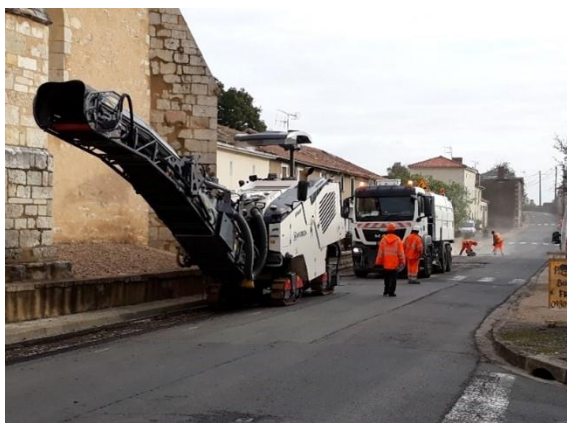
Réfection d'une partie de la route du Bourg