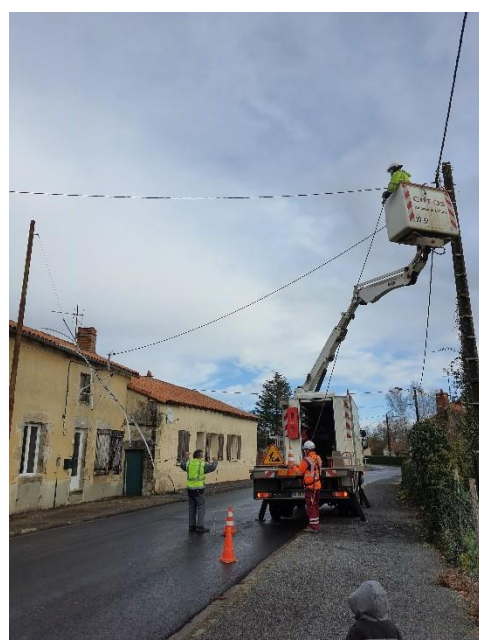
Mise en place des décorations de Noël