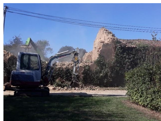
Démolition d'une maison à la Bernardrie