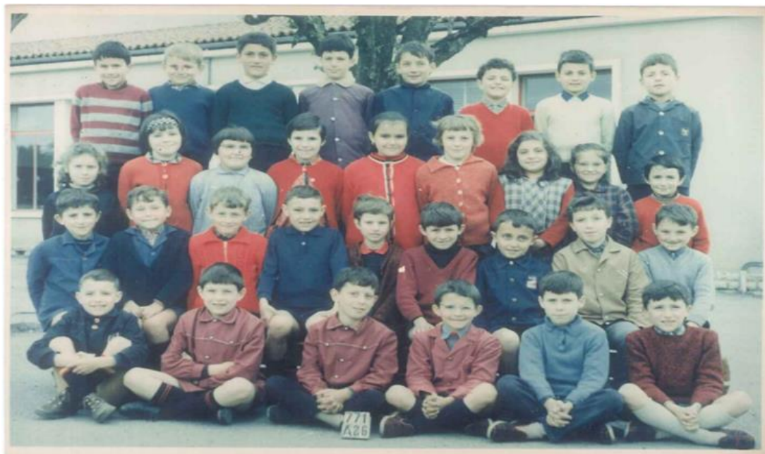
Voici une photo de classe de la Chapelle-Bâton en 1966/1967. Les reconnaissez-vous ? Nous comptons sur vous pour nous donner les noms des écoliers.

La photo des mariées présenté dans le A Capella ! n°1, il s'agirait du mariage de M et Mme GAGNAIRE qui habitait à la Clie.