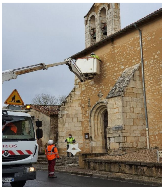
Mise en place des décorations de Noël