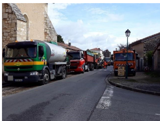
Bouchon lors de la réfection de la route du Bourg