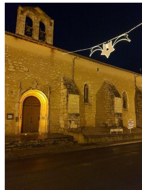
Illumination réalisé par Rémi, notre employé communal